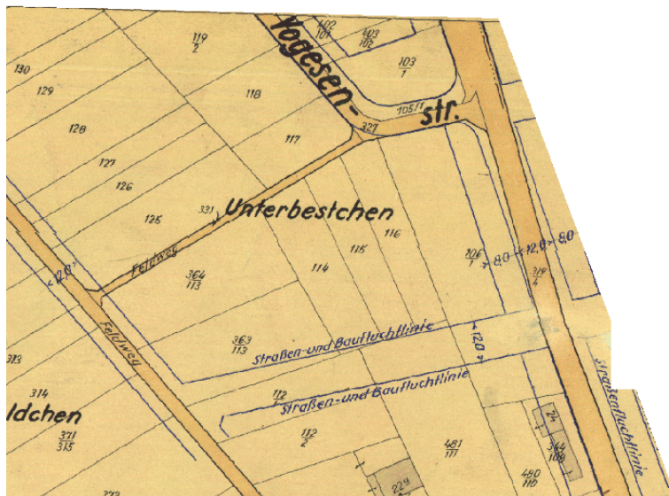
Ausschnitt aus dem Plan nach dem Hessischen Aufbaugesetz

Erstellt: Stadtplanungsamt Gustav-Stresemann-Ring 15 65189 Wiesbaden stadtentwicklung@wiesbaden.de