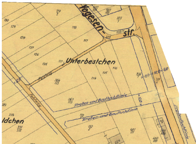
Ausschnitt aus dem Plan nach dem Hessischen Aufbaugesetz

Erstellt: Stadtplanungsamt Gustav-Stresemann-Ring 15 65189 Wiesbaden stadtentwicklung@wiesbaden.de