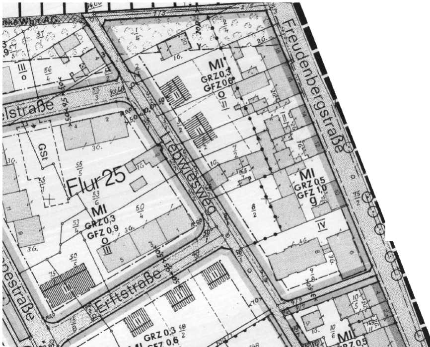
Ausschnitt aus dem Bebauungsplan

Erstellt: Stadtplanungsamt Gustav-Stresemann-Ring 15 65189 Wiesbaden stadtentwicklung@wiesbaden.de