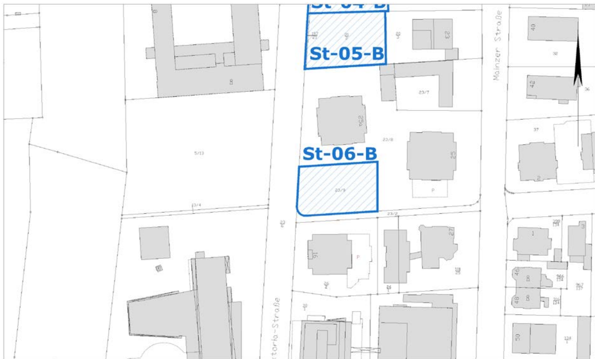
Ausschnitt aus der Stadtgrundkarte

Anmerkungen: Die Beurteilung erfolgt nach § 34 BauGB - Zulässigkeit von Vorhaben innerhalb der im Zusammenhang bebauten Ortsteile.