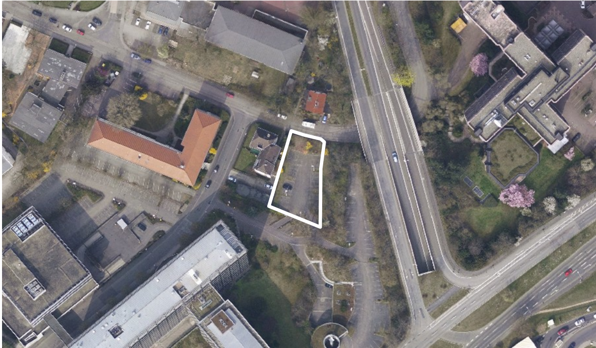
Luftbild (März 2011)