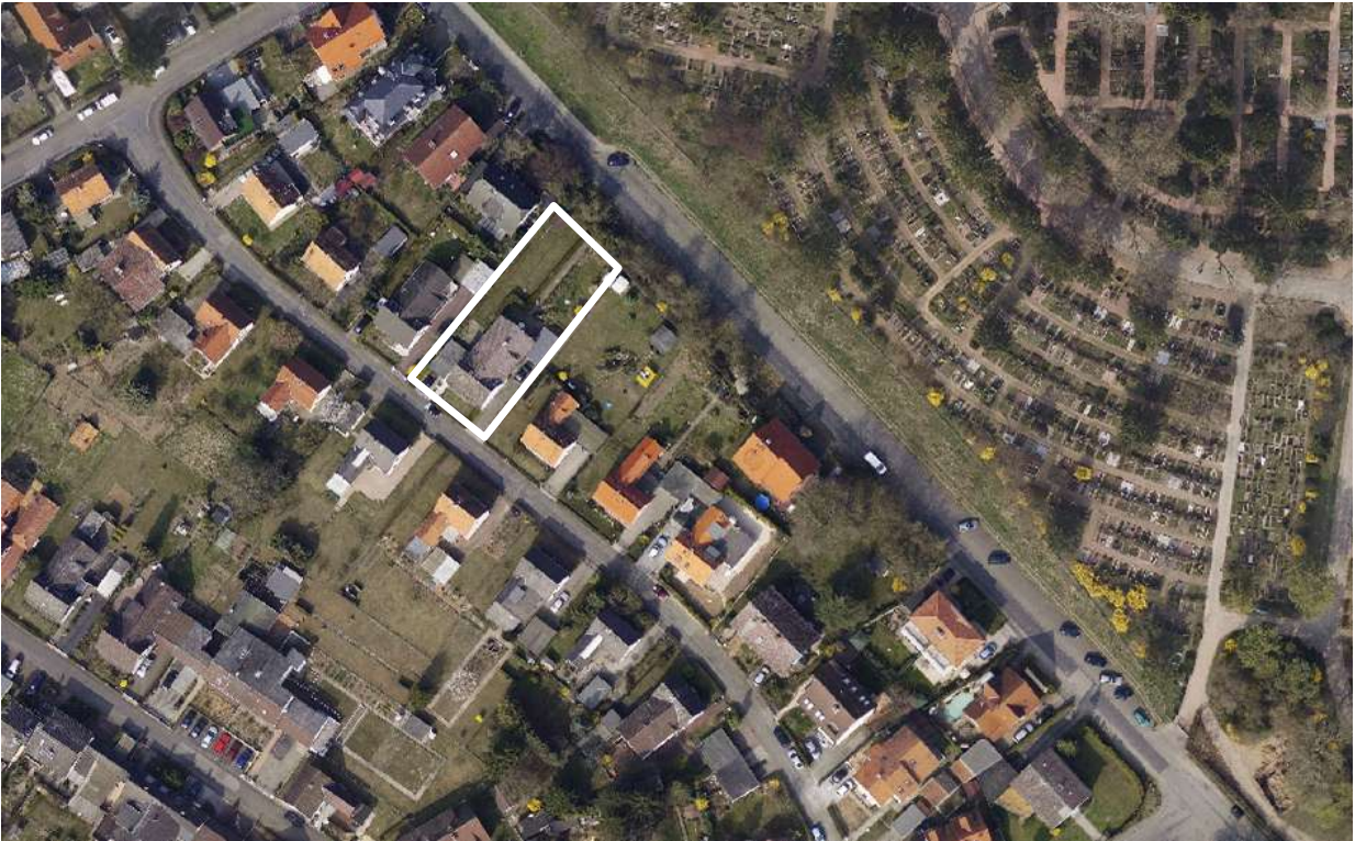
Luftbild (März 2011)