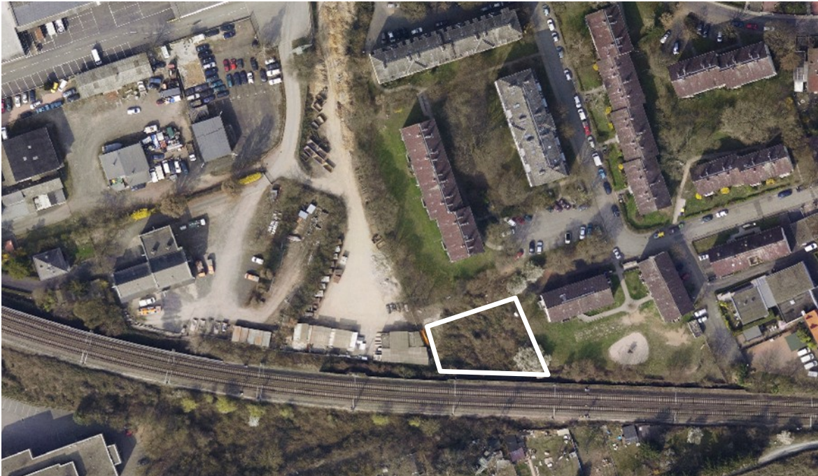
Luftbild (März 2011)