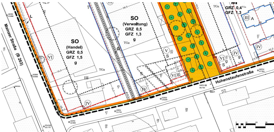
Kartengrundlage Tiefbau- und Vermessungsamt