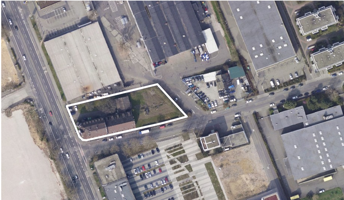
Luftbild (März 2011)