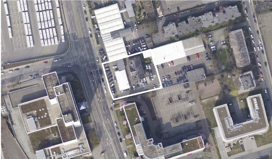
Luftbild (März 2011)