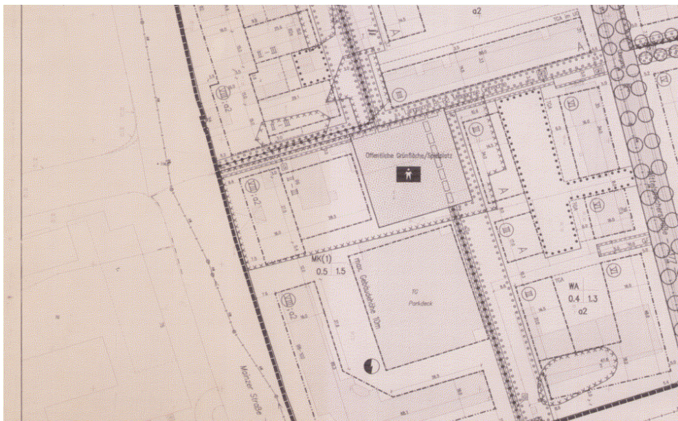
Ausschnitt aus dem Bebauungsplan

Erstellt: Stadtplanungsamt Gustav-Stresemann-Ring 15 65189 Wiesbaden stadtplanung@wiesbaden.de