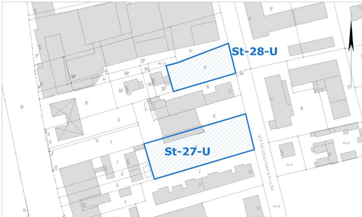
Ausschnitt aus der Stadtgrundkarte