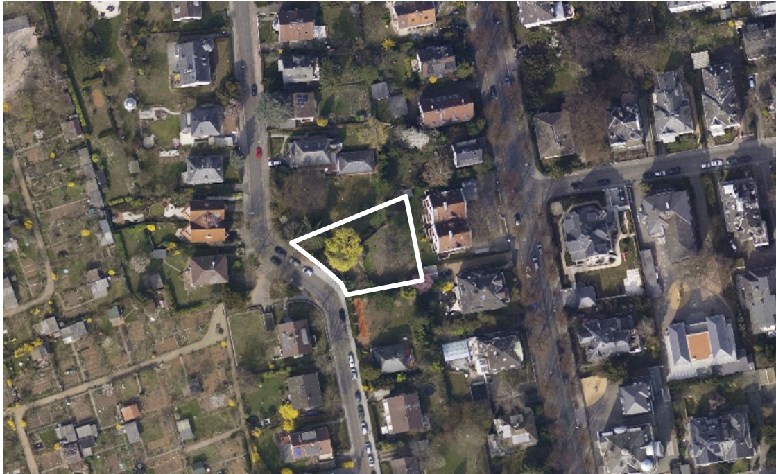
Luftbild (März 2011)