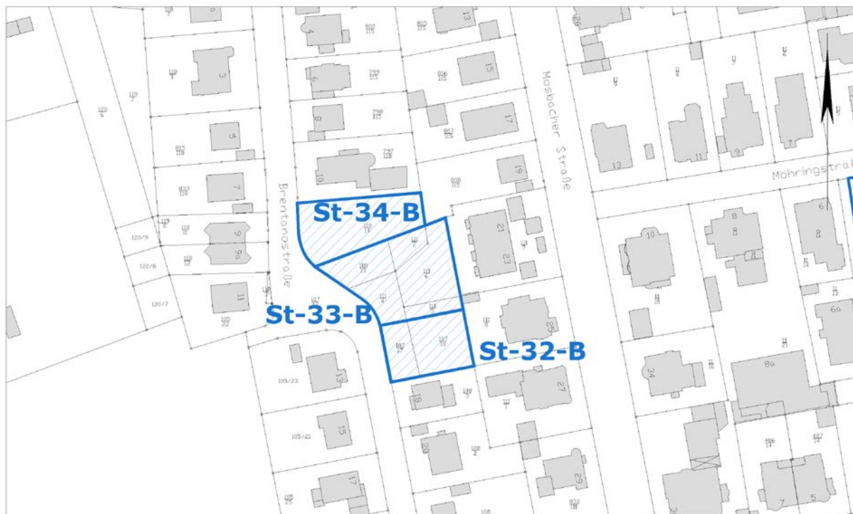
Ausschnitt aus der Stadtgrundkarte

Anmerkungen: Angrenzend Denkmalschutz (Gesamtanlage, Umgebungsschutz gemäß § 16 (2) HDSchG)