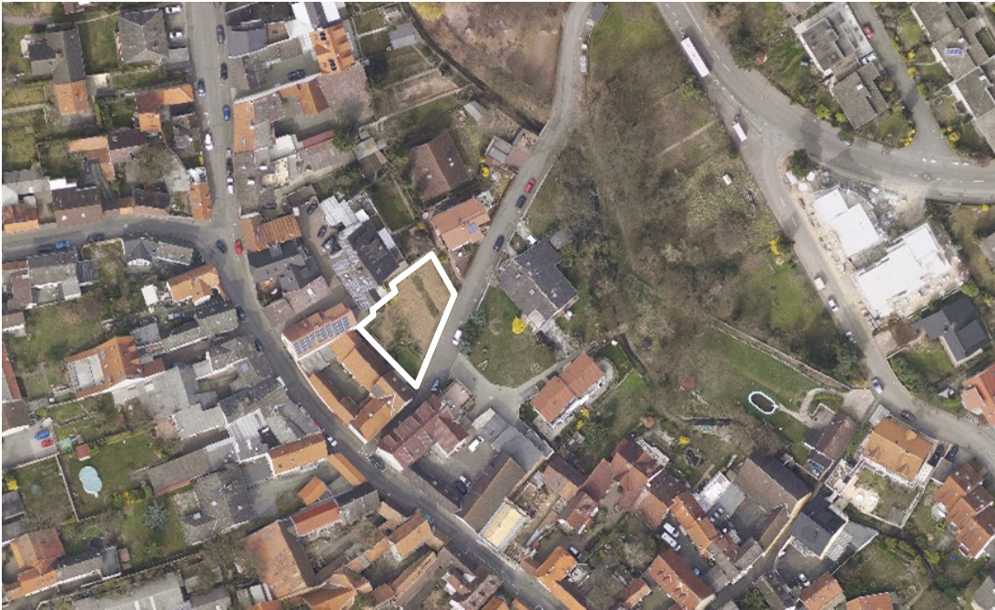
Luftbild (März 2011)