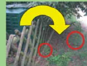
Von einem Garten ausgehende Ausbreitung