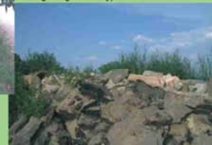
Ablagerungen sind typische Wuchsorte