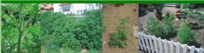
Stand: Juni 2007

Post: Projektgruppe Biodiversität, Hinter'm Alten Ort 9, D-61169 Friedberg