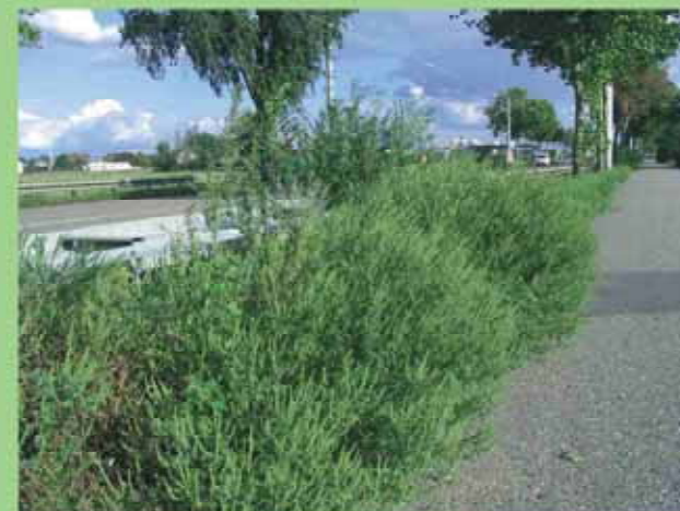
Vorkommen entlang der Bundesstraße 44 bei Mannheim

Die Pollen der Beifuß-Ambrosie ( Ambrosia artemisiifolia ) sind stark allergieauslösend und können Heuschnupfen und Asthma hervorrufen. Der Kontakt mit Ambrosia-Pflanzen kann zu allergischen Hautreaktionen führen. Daher sollte die weitere Ausbreitung der Beifuß-Ambrosie in Deutschland verhindert werden.