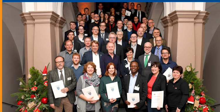
Die Wiesbadener ÖKOPROFIT-Betriebe 2018/2019 und der ÖKOPROFIT-Elektrobus