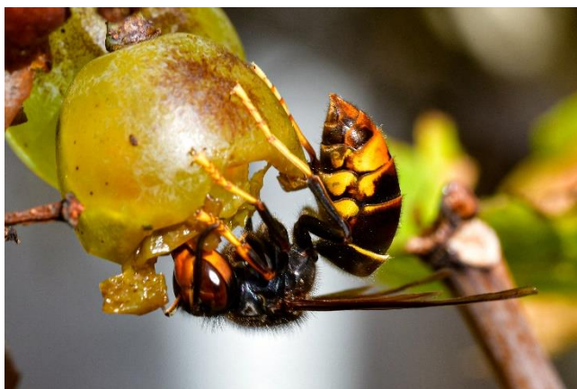
Am Weinstock - Worms 2021

Reiner Jahn / www.velutina.de - darf gerne geteilt werden!