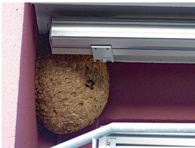
Heppenheim Balkon - Dezember 2021