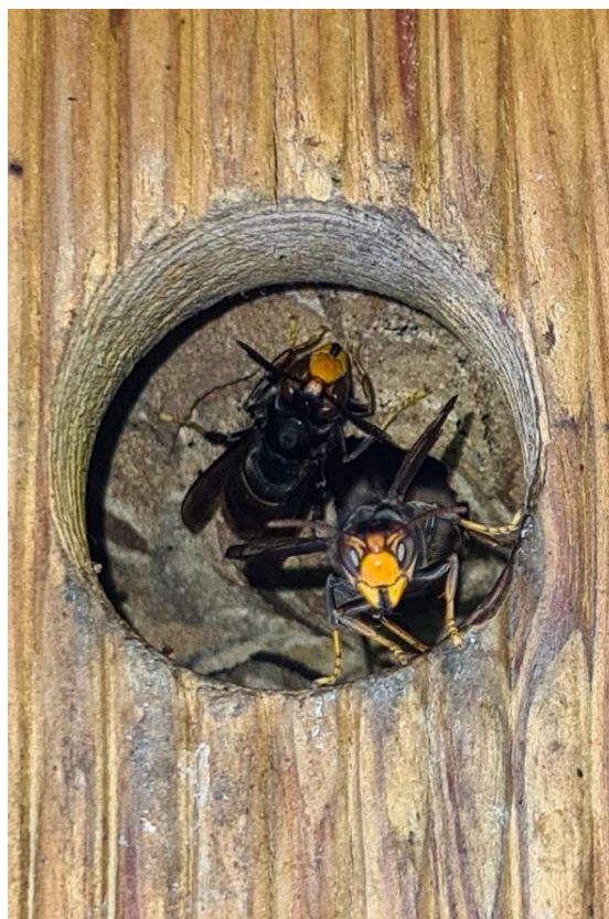
Heppenheim Vogelhaus - Juli 2022