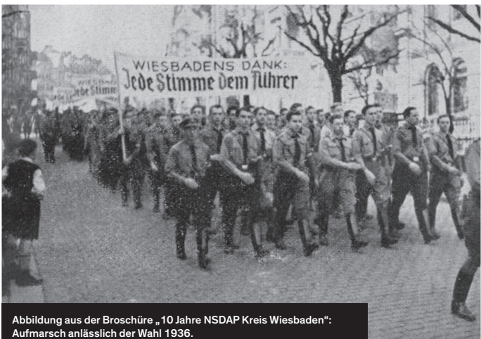
Abbildung aus der Broschüre „10 Jahre NSDAP Kreis Wiesbaden“: Aufmarsch anlässlich der Wahl 1936.

Die Wiesbadener Ortsgruppe der NSDAP wurde 1926 gegründet. Mit ihrem brutalen Vorgehen setzte die Sturmabteilung (SA) politische Gegner unter Druck und heizte damit das politische Klima in Wiesbaden auf. Bei der Reichstagswahl im März 1933 erhielt die NSDAP 46,2 Prozent der Stimmen in Wiesbaden und damit mehr als im Reichsdurchschnitt. Dort lag ihr Zuspruch bei 43,9 Prozent. Beinahe jeder fünfte erwachsene Wiesbadener war NSDAP-Mitglied oder unterstützte das nationalsozialistische Regime auf andere Weise.