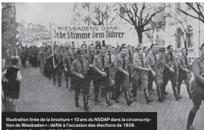
Illustration tirée de la brochure « 10 ans du NSDAP dans la circonscription de Wiesbaden » : défilé à l'occasion des élections de 1936.

La section locale du NSDAP à Wiesbaden a été fondée en 1926. Par ses méthodes brutales, la Sturmabteilung (SA) faisait pression sur les opposants au régime, exacerbant le climat politique à Wiesbaden. Lors des élections au Reichstag en mars 1933, le NSDAP obtint 46,2 % des voix à Wiesbaden, soit plus que la moyenne nationale qui s'élevait alors à 43,9 % des voix. Près d'un adulte sur cinq à Wiesbaden était membre du NSDAP ou soutenait le régime national-socialiste d'une autre manière.