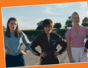
Comme des garçons