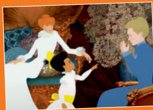
Dilili à Paris

7 FILME, CA. 15 VERANSTALTUNGEN. ZUM BEISPIEL: