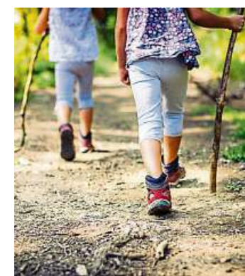
Wandern ist eine beliebte Freizeitbeschäftigung (Symbolbild).