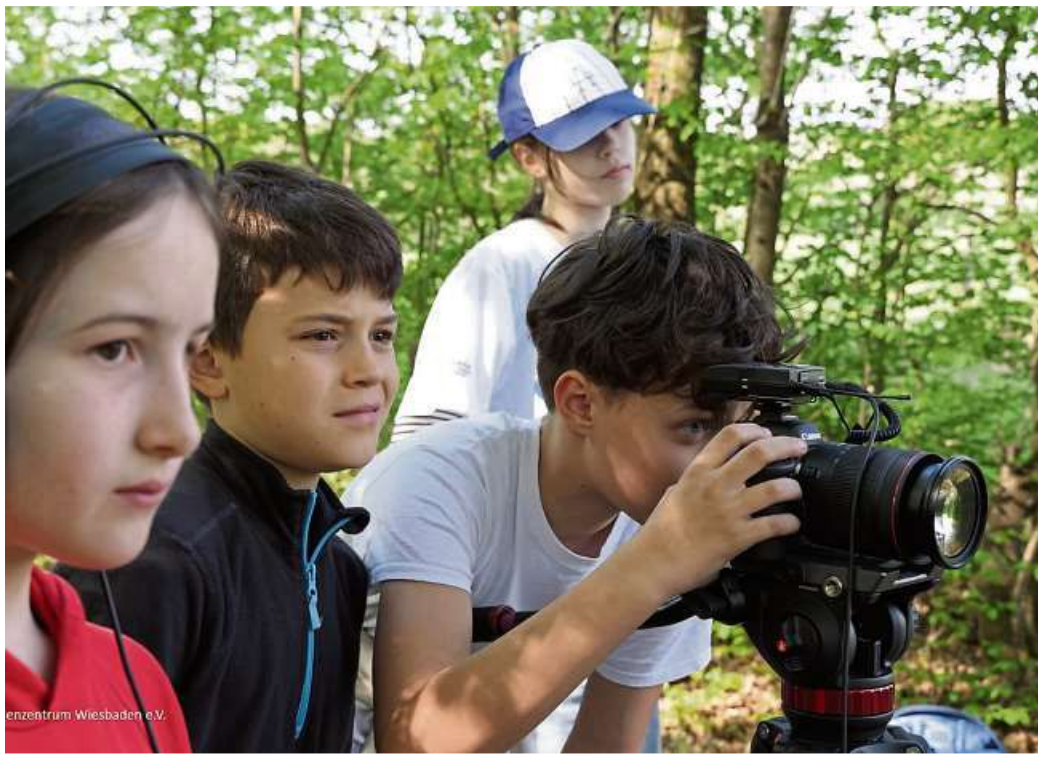
Dreharbeiten zum Film „Echt!?“.

WIESBADEN (red). Die Werkstatt der Jungen Filmszene findet von Freitag bis Pfingstmontag, 22. bis 25. Mai, im Wilhelm-Kempf-Haus in Naurod und in der Caligari FilmBühne in Wiesbaden statt. Ein Highlight ist der feierliche und öffentliche Kurzfilmabend am Samstag, 23. Mai, in der Caligari Film-Bühne, bei dem die jungen Filmschaffenden über den roten Teppich laufen. Diese Vorführung steht allen Interessierten offen. Das vielfältige Kurzfilmabend-Programm mit sechs Filmen reicht von einer liebevollen Animation über eine humorvolle Komödie bis hin zu spannenden Dokumentarfilmen. Gezeigt werden auch Beiträge aus dem Projekt filmreif beziehungsweise der allgemeinen medienpädagogischen Arbeit des Medienzentrums Wiesbaden.