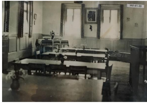
Abb. 2: Rathausschule (bis 1900)

Die letzte große Sanierungsmaßnahme fand in den 1980er Jahren statt. Hierbei wurde umfangreich in die Bausubstanz eingegriffen, wobei vor allem das historische Fachwerkgefüge im Erdgeschoss massiv verändert wurde.