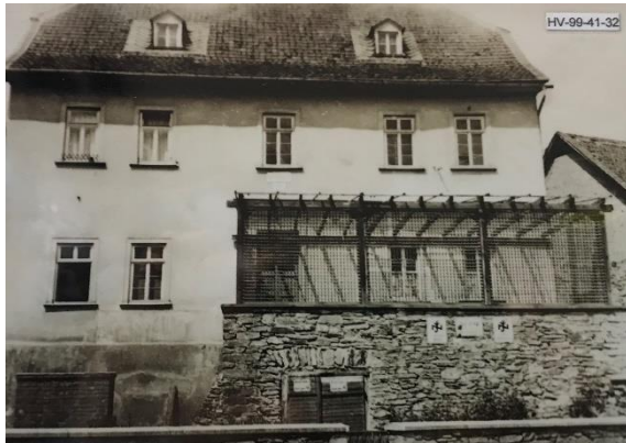
Abb. 1: Straßenansicht (vor 1980)

Das Alte Rathaus in Kloppenheim wurde in den 1750er Jahren als zweigeschossiger Fachwerkbau errichtet. Spätestens seit 1817 wird das Gebäude als Rath und Schulhaus zu Kloppenheim erwähnt. Das mit einem Krüppelwalmdach gedeckte Gebäude verfügt über eine Teilunterkellerung die aufgrund der Geländetopographie straßenseitig als Bruchstein-Sockelgeschoss in Erscheinung tritt.