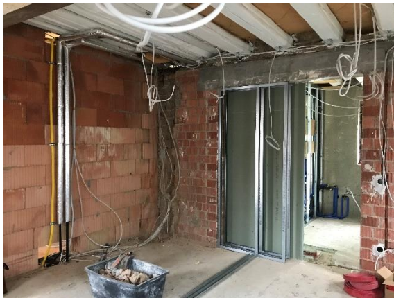
Abb. 4: Bauzustand künft. Vereinszimmer (04.07.2024)

Einschließlich der konjunkturbedingten Preissteigerungen betragen die erwarteten Mehrkosten für die zusätzlichen Maßnahmen 800.000 Euro, insgesamt also 1,6 Mio. Euro.