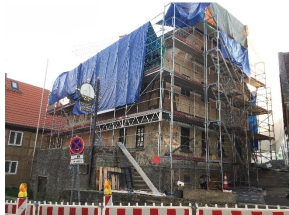
Abb. 5: Fassadenarbeiten (05.09.2024)

Da das Alte Rathaus nach Hessischem Denkmalschutzgesetz als Einzelkulturdenkmal unter Schutz steht, wurden sämtliche Eingriffe eng mit dem Denkmalschutz abgestimmt und die geplanten Arbeiten im Zuge eines Bauantragsverfahrens durch diesen genehmigt. Es ist dem sensiblen Umgang aller Beteiligten mit dieser anspruchsvollen Bausubstanz zu verdanken, dass aus dem Alten Rathaus nach einem langjährigen „Dornröschenschlaf“ und nur 12 Monaten Bauzeit nun ein echtes Schmuckstück entstanden ist, das den Kloppenheimer Bürgerinnen und Bürgern jetzt wieder als neuer Orts-Mittelpunkt und Treffpunkt des Vereinslebens zur Verfügung gestellt werden kann. Damit trägt das Hauptamt der Verpflichtung der Landeshauptstadt Wiesbaden Rechnung, das bauhistorische Erbe im Gebäudebestand sukzessive zu sanieren und damit- wie etwa auch beim „Backes“ in Naurod- für zukünftige Generationen zu erhalten.