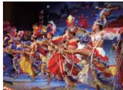
美因兹狂欢节

狂欢纪念柱。有了大老板的承诺，美因兹就请来了德国最好的艺术雕塑家，设计和建造了这座青铜纪念柱。饮料厂老板拿到账单的时候，简直悔不当初。