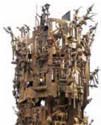
美因兹狂欢喷泉青铜柱

其实，这根狂欢纪念柱也是一个狂欢粉丝烧包的结果。美因兹有一家著名的饮料生产厂家，其生产的橙汁饮料在德国享有声誉。七十年代的时候，老板为了让女儿当选上狂欢公主，答应给市里捐助一座