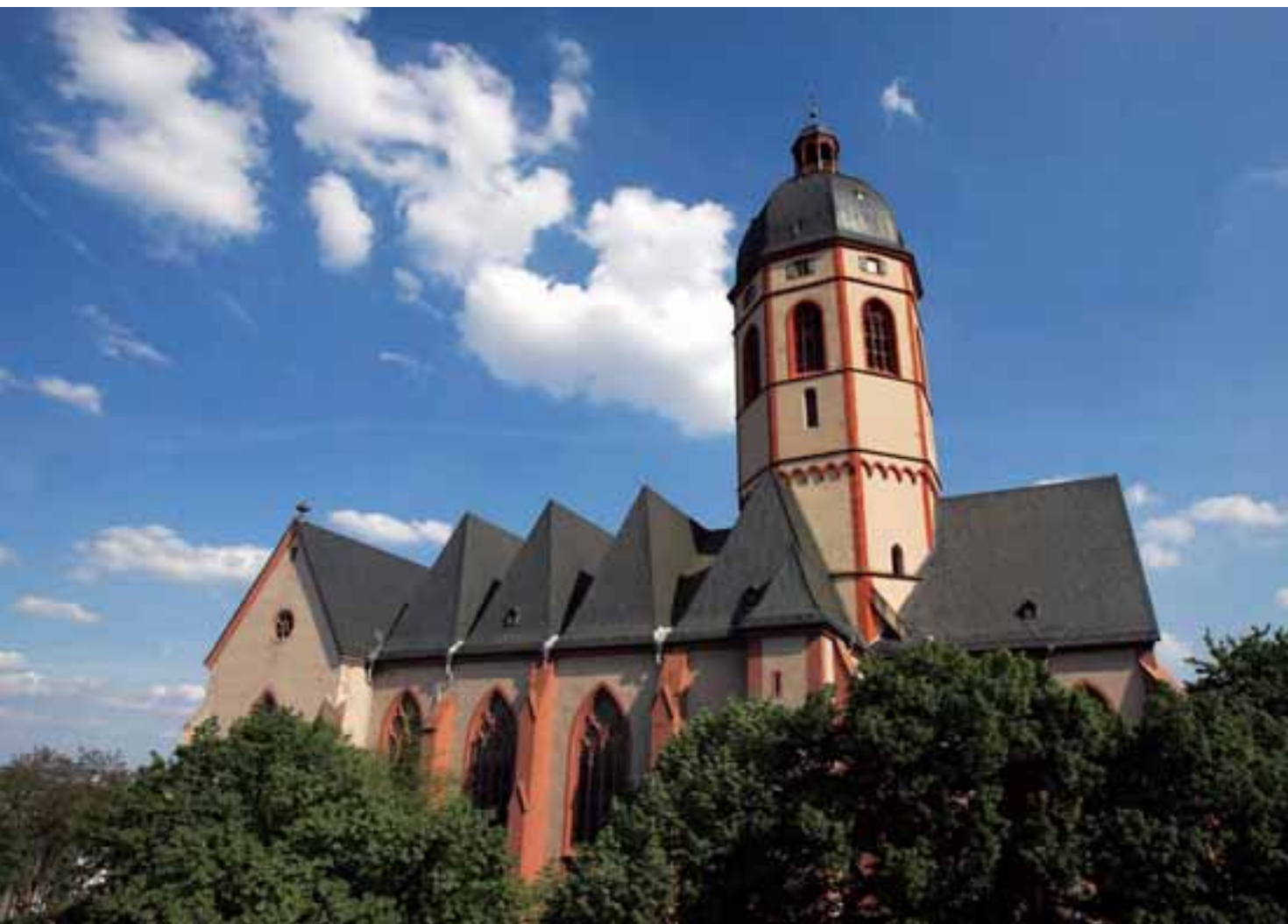
美因兹圣斯坦方教堂

法国，还在凡尔赛宫里举行过加冕典礼，可见两国世世代代的仇恨难解难化。麦耶神父通过彩绘玻璃窗这件事，化解了这两个矛盾，为基督教和犹太教、为德国和法国架起了一座和平友谊的桥梁。而圣斯坦方教堂的彩绘玻璃窗，如今已成为美因兹最吸引欧洲游客的景点之一了。