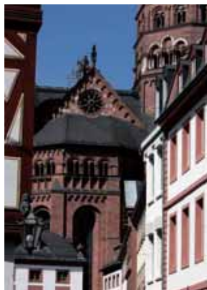
美因兹席勒广场 和圣斯坦方教堂