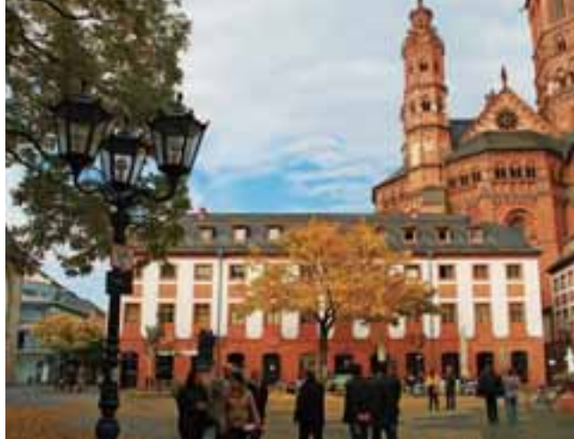
美因兹风景

而这座城市的形成也非常符合罗马帝国的愿望，罗马皇帝干脆把这里作为日耳曼的首都，来统领日耳