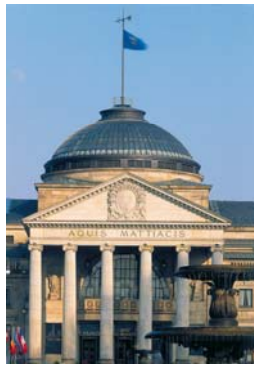
威斯巴登疗养大楼