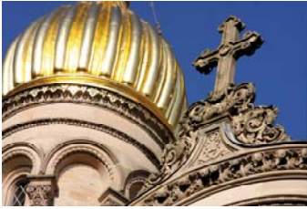
威斯巴登的俄罗斯风格教堂